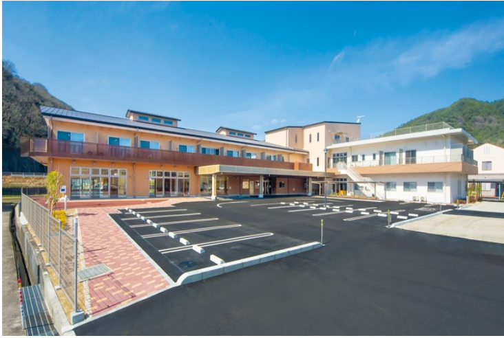
複合型介護福祉施設(小多機・サ高住・障がい者GH)