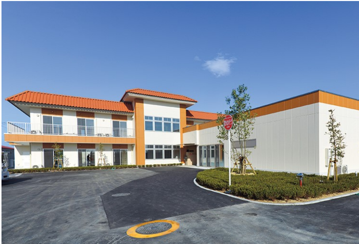
特別養護老人ホーム 地域密着