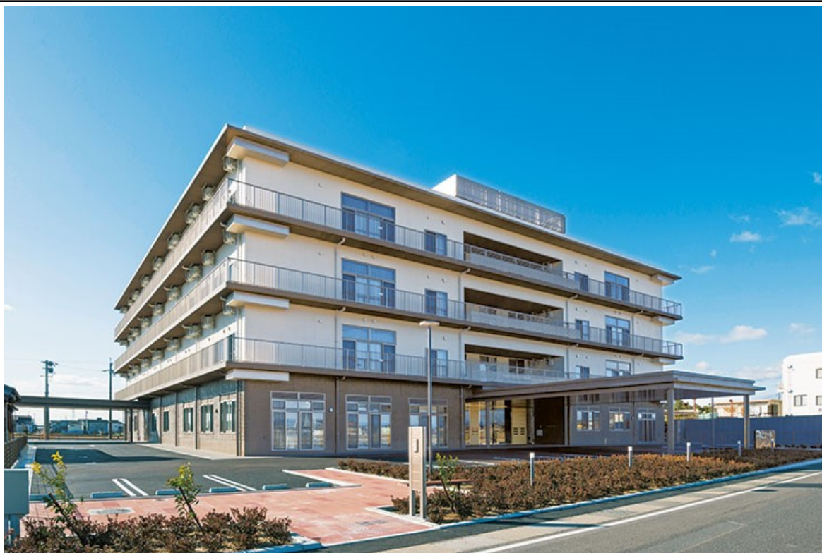
特別養護老人ホーム(広域)