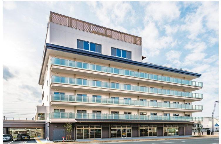
サ高住+保育複合施設