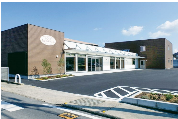
障がい者就労支援施設